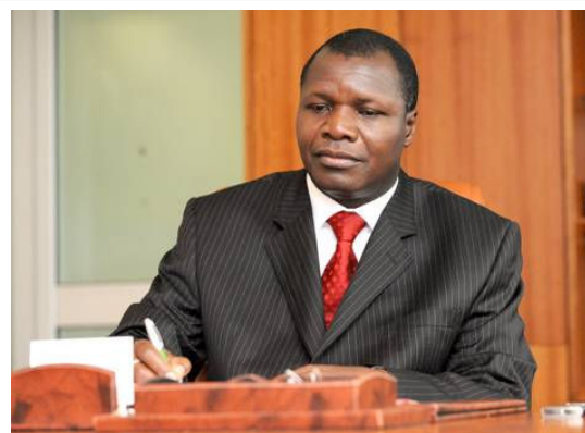
Dr Albert MABRI TOIKEUSSE, Président de l'UDPCI

La Côte d'Ivoire a réalisé des progrès importants depuis son accession à l'indépendance en 1960. Elle s'est dotée au fil des ans, de moyens qui lui ont permis de prendre en main son destin. Ces avancées, le pays le doit à la dynamique sociale fondée sur un climat de paix et un mouvement d'affirmation nationale impulsé par son premier Président, Félix HOUPHOUËT BOIGNY, ce grand visionnaire.