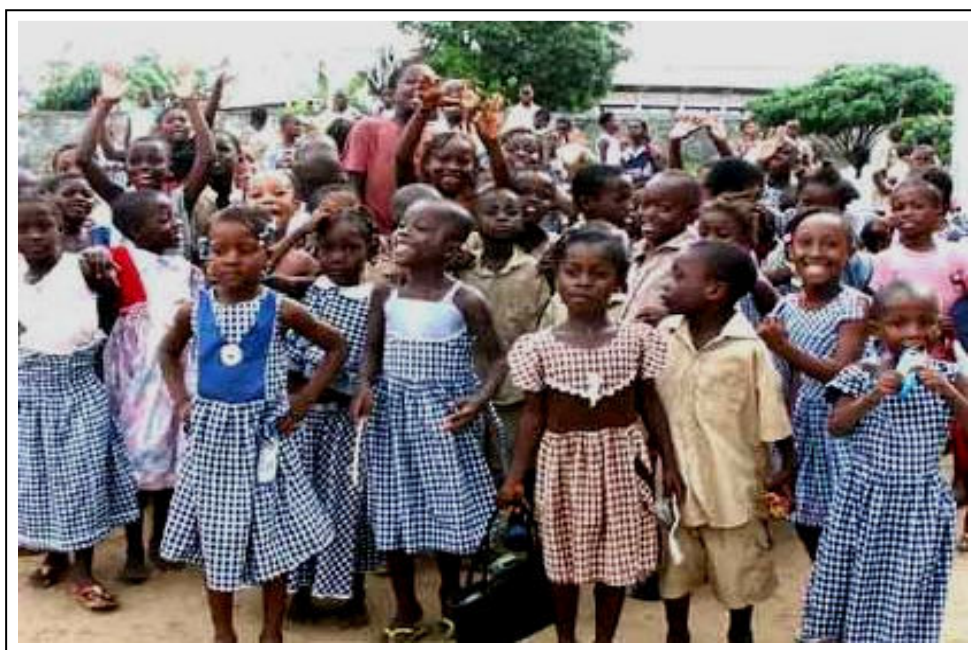
Une jeunesse bien formée pour une Côte d'Ivoire meilleure

Le relèvement du niveau d'instruction de la Société impose pour l'UDPCI d'arriver à faire atteindre au moins la classe de 3 ème à tous sans exclusion.