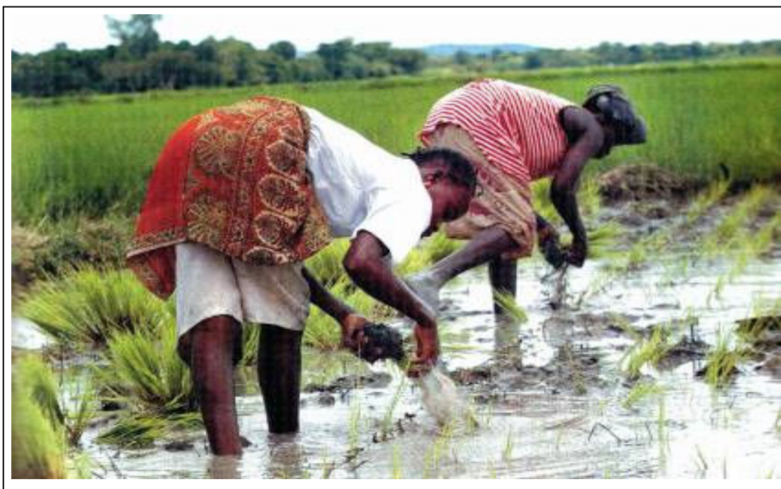
Femme et riziculture

La protection des droits de la Femme sera une priorité pour l'UDPCI. Ainsi, la Femme sera dans les conditions requises pour apporter plus à la famille et à la Société. Plus spécifiquement, la femme rurale et celle des zones urbaines défavorisées doivent bénéficier davantage du soutien de l'Etat.