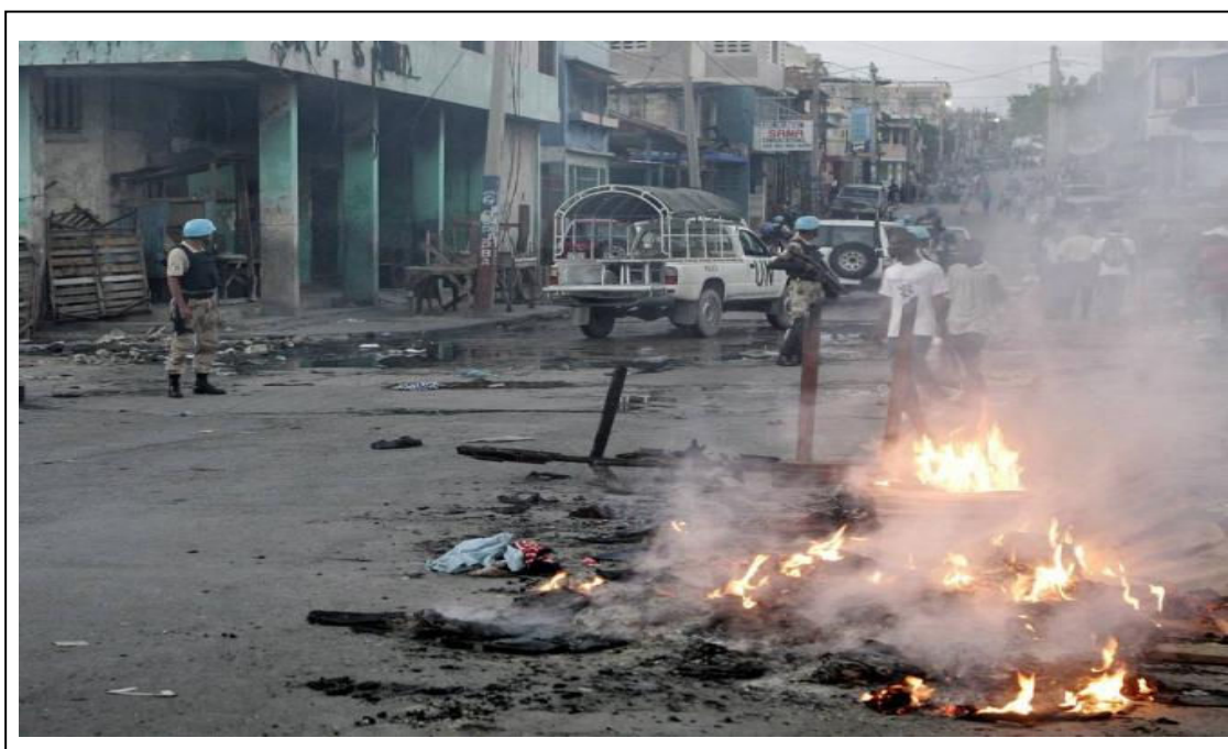
Le désastre doit être évité à tout prix

Dans sa détermination à affronter ce tableau qui risque de tout compromettre, l'UDPCI propose une rupture avec les approches actuelles aux fins de parvenir à une Côte d'Ivoire réconciliée, fraternelle, plus solidaire, plus dynamique et plus équitable. Telle est l'ambition que présente le présent Projet de Société.