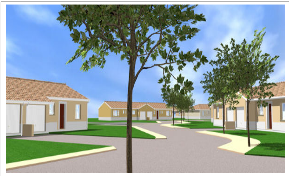
Un Cadre de Vie adéquat pour le bien-être des populations

Les travailleurs retraités , les personnes du troisième âge et les handicapés devront bénéficier de programmes spéciaux susceptibles de leur assurer le bien-être partout et de tout temps.