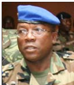
Général Soumaïla Bakayoko , chef d'état-major des FAFN (ci-dessus)

Général Dogbo Blé , patron de la Garde républicaine