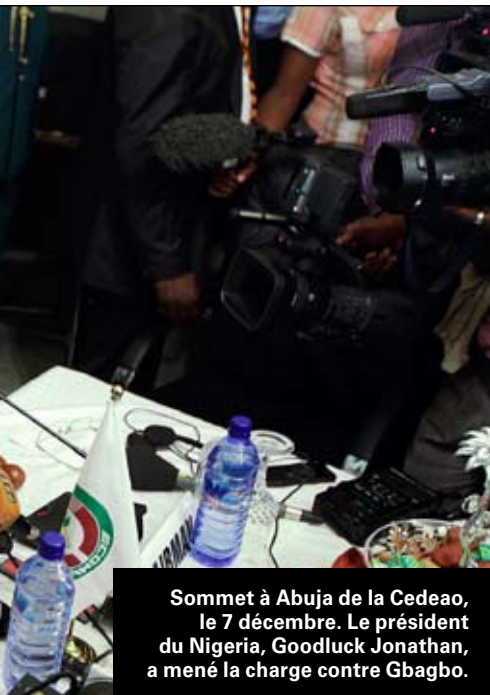
Sommet à Abuja de la Cedeao, le 7 décembre. Le président du Nigeria, Goodluck Jonathan, a mené la charge contre Gbagbo.