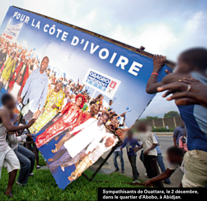
Sympathisants de Ouattara, le 2 décembre, dans le quartier d'Abobo, à Abidjan.