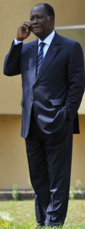
Alassane Ouattara dans les jardins du Golf Hôtel, le 8 décembre.