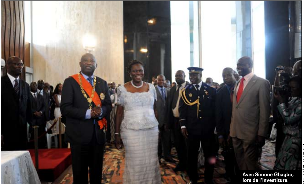
Avec Simone Gbagbo, lors de l'investiture.