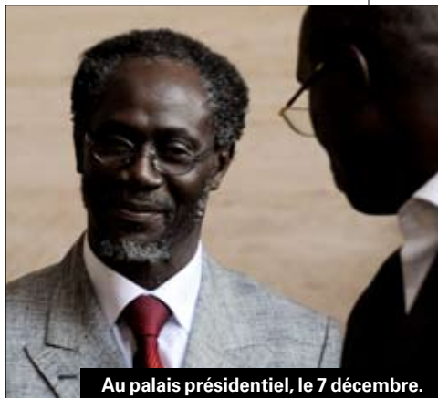
Au palais présidentiel, le 7 décembre.