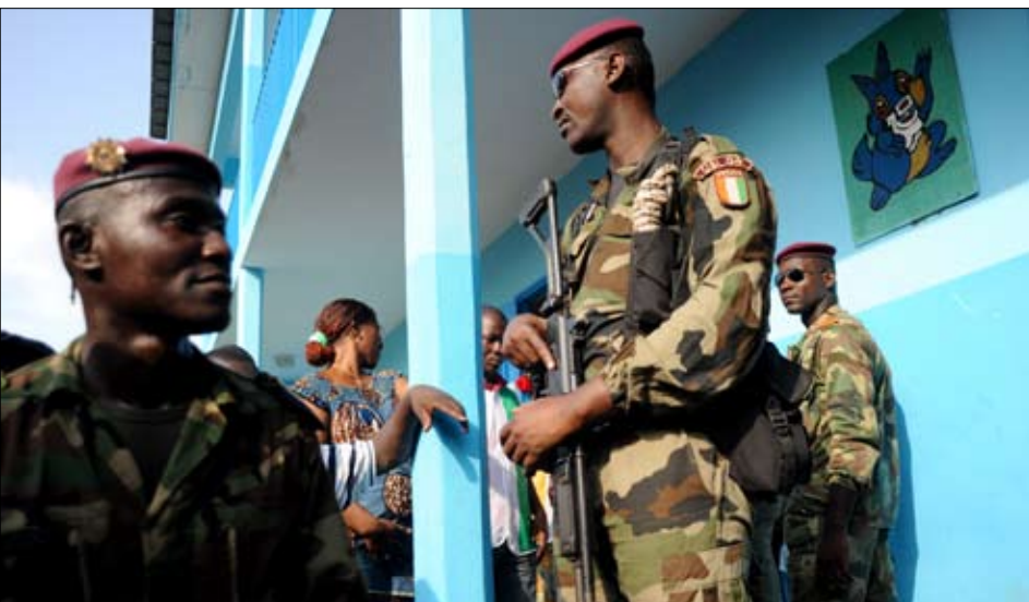
Soldats de la garde républicaine, le 28 novembre à Abidjan, lors du second tour.