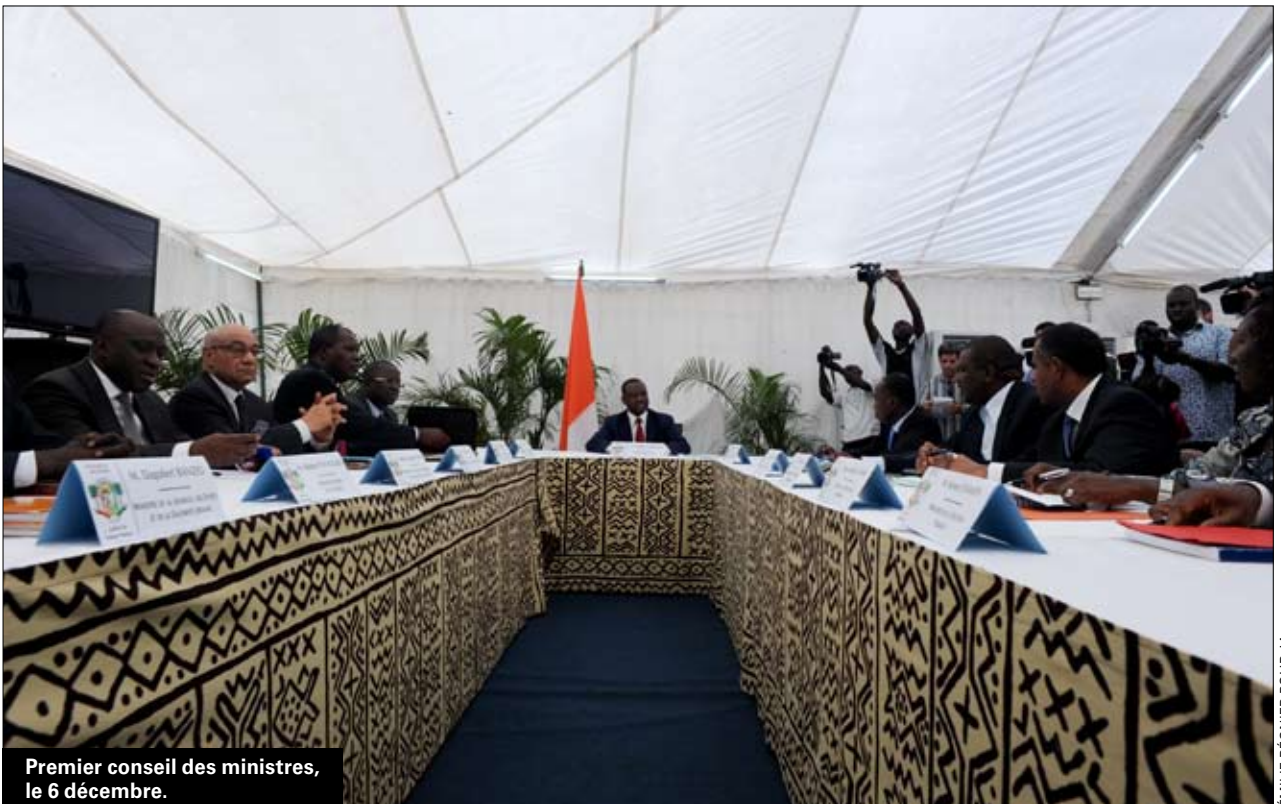
Premier conseil des ministres, le 6 décembre.