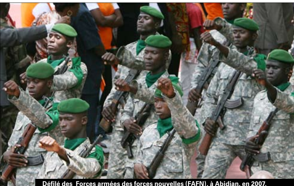
Défilé des Forces armées des forces nouvelles (FAFN), à Abidjan, en 2007.